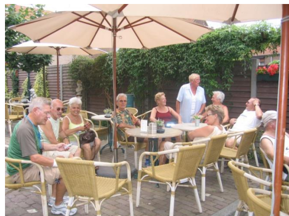
Samenkomst van de twee groepen bij een deugddoende tussenstop in IJzendijke