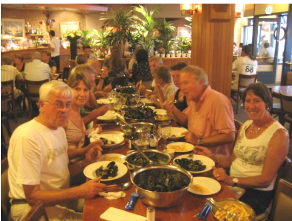
Kommen vol Zeeuwse mosselen