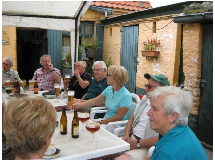
De fietsers blazen uit rond de tafel