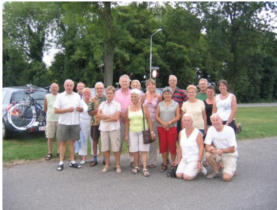
Groepsfoto na de rit