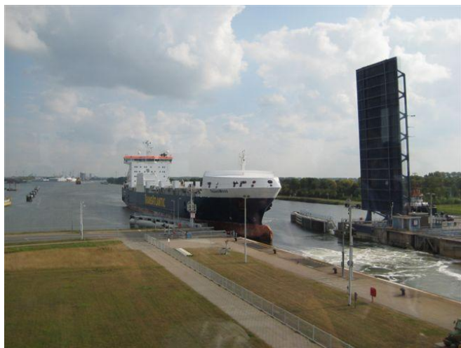
Een zeereus vaart in de sluis op weg naar Gent