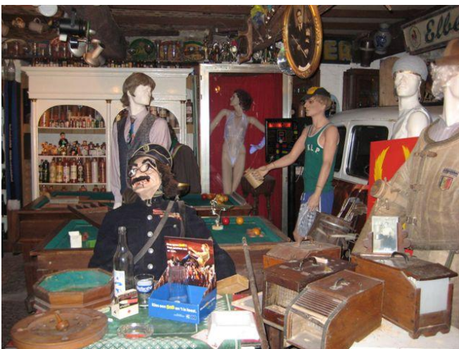
Eén van de rariteitenkabinetten in het museum