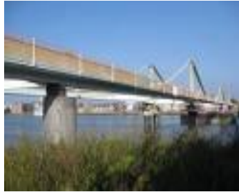
Figuur 1 De kaai in Temse met de kaailopers.