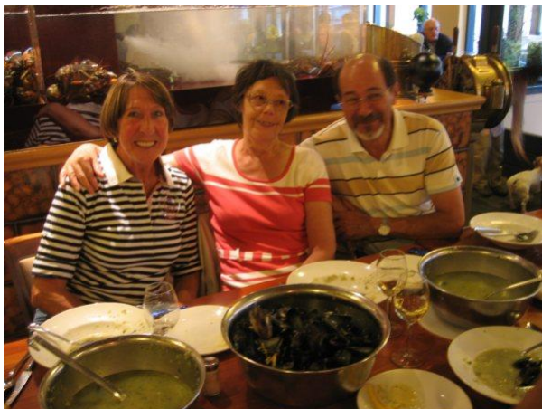
De mosselen deden deugd of was het de mosselwijn?