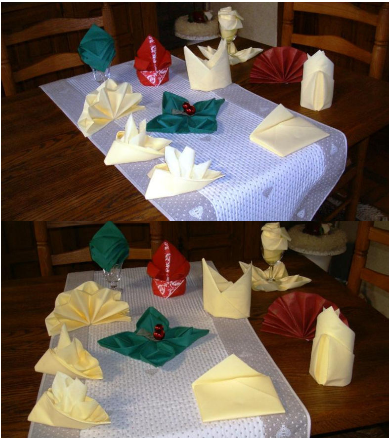
2 voorbeelden hobby 16/9, servetten vouwen

Ter info : hobbynamiddag elke 3 de donderdag van de maand telkens om 14u30 in de cafetaria veranda van het cultureel centrum, abdij Affligem