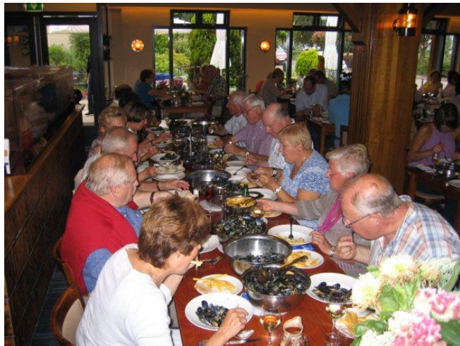
Mosselen in overvloed