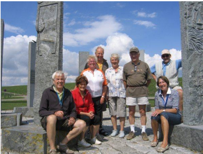
Monument watersnoodramp 1953