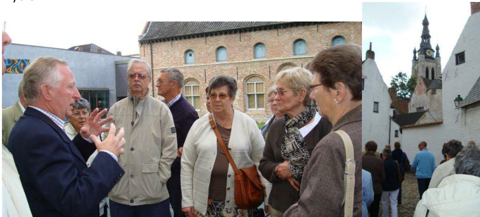
info door de gids