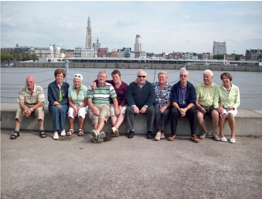
Prachtig zicht : op Antwerpen en onze fietsers