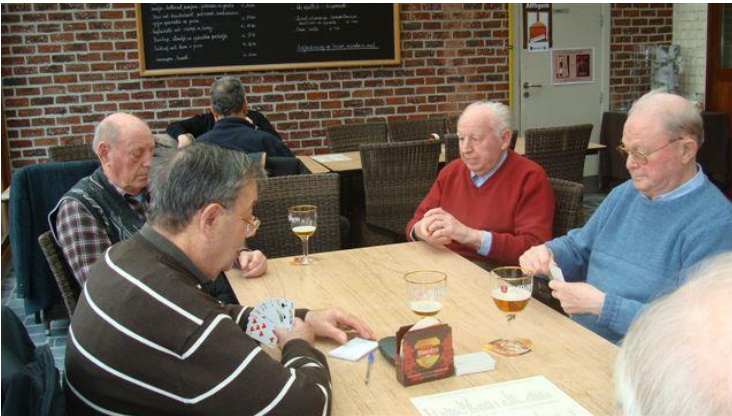
Kaarters aan "het werk" na de koffie.