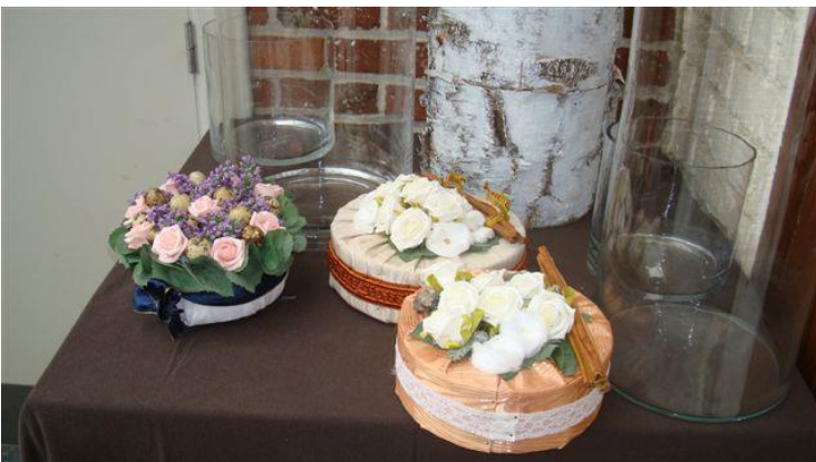
Recente creaties van de hobbyclub.